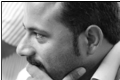
احمد احمدی نژاد

سرمقاله ۳ / نگاه؛ باز آمد بوی ماه مهر ۴ / دل نوشته؛ نیمکت‌های مدرسه، بوم‌های نقاشی نازیبا ۵ / گفت‌وگو؛ تدریس زبان قومیت‌ها در مدارس اولویت من است ۶ / دیدگاه؛ آموزش بزرگسالان و سوادآموزی در ایران ۷ / رویداد؛ کارگاه؛ توانمندسازی معلمان ۸